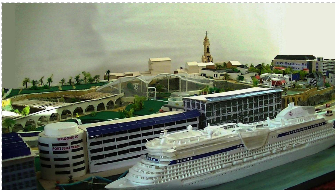
Maquette Port Jules Verne – Terminal croisière, Vernoscope et Espace Audubon