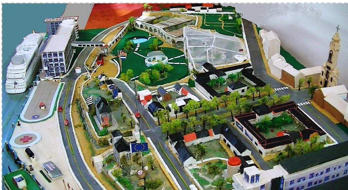
Maquette Port Jules Verne – Vue aérienne Butte Ste Anne, Espace Audubon, Vernoscope et Terminal croisière