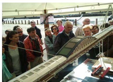
Une assistance nombreuse et passionnée

Au cours de ces heures d'échanges avec les Nantais, où l'assistance se renouvelait sans cesse, il a été calculé que près de 800 visiteurs ont pu s'informer sur le nouveau Pont à Transbordeur, et parmi elles 140 personnes ont acheté la CARTE POSTALE que nous avons éditée spécialement